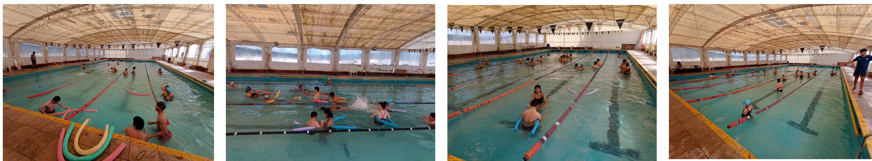
Ilustración 1. Imágenes de las actividades desarrolladas en el PEU